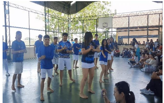
Figura 30: Apresentação 1º 3 – Boi Bumbá de Parintins