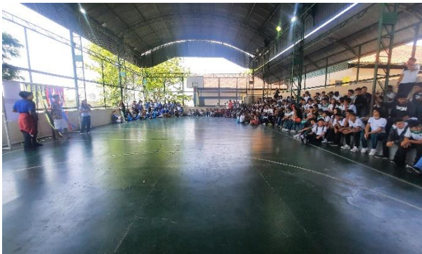
Figura 23: Festival de Danças Culturais

Por fim, a turma do 1º ano 5, ao selecionar o Festival de Maués como seu foco, destacando a tradicional Dança do Guaraná. Em sua performance, incorporaram a representação de uma índia, enriquecendo a apresentação com uma interpretação viva da lenda do Guaraná. A inclusão desse elemento narrativo cativante conferiu profundidade e significado à sua performance.