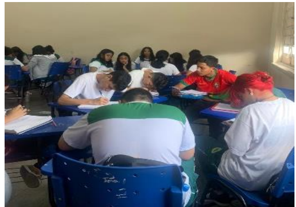
Figura 12: Atividade de pesquisa sobre Danças da Região Norte