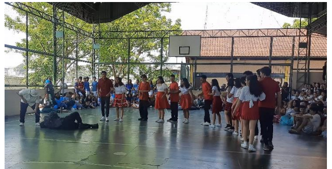
Figura 26: Apresentação 1º 4 – Ciranda de Tefé