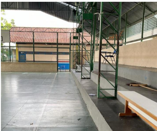
Figura 6: Quadra da Escola (arquibancada)