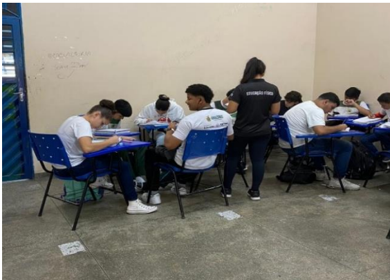
Figura 11: Atividade de pesquisa sobre Danças da Região Norte