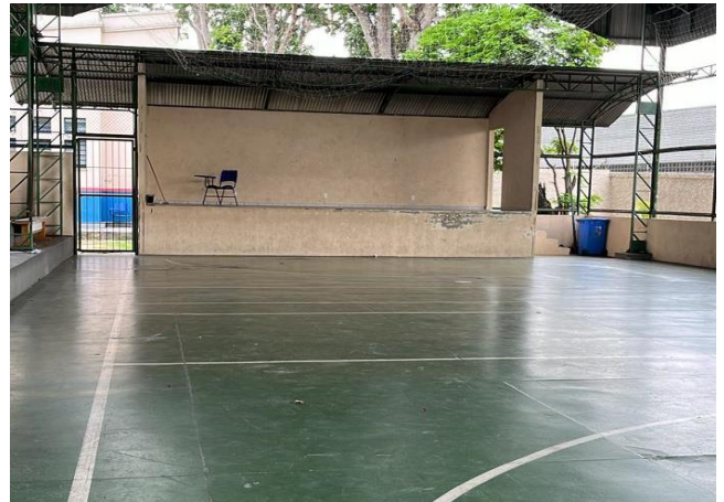
Figura 5: Quadra da Escola (palco)