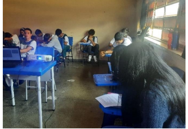
Figura 9: Aplicação do Questionário