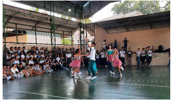
Figura 28: Apresentação 1º 2 – Ciranda de Manacapuru