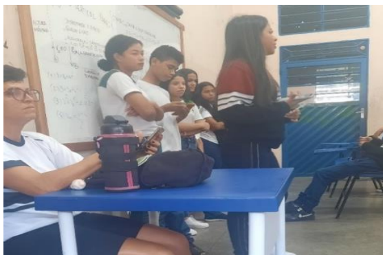
Figura 13: Apresentação dos grupos