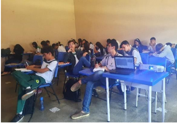
Figura 8: Aplicação do Questionário