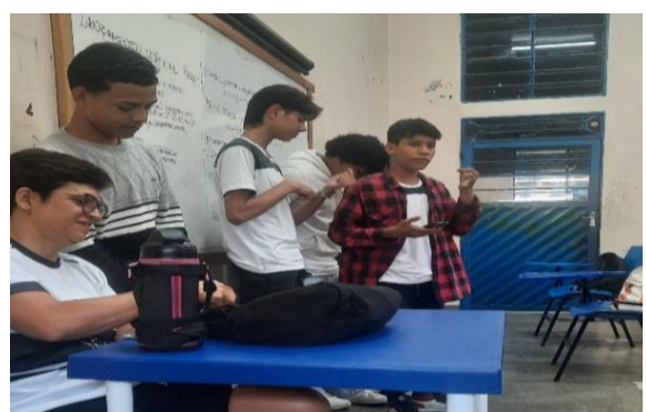
Figura 14: Apresentação dos grupos