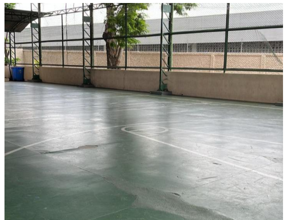
Figura 7: Quadra da Escola (lateral)