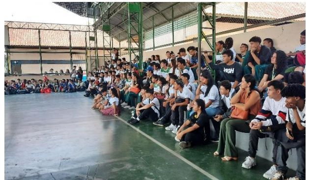
Figura 24: Presença das turmas no festival