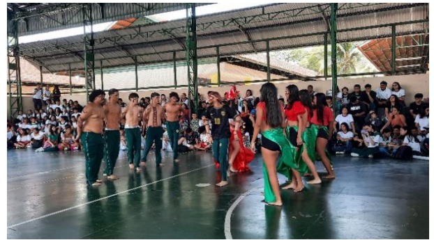
Figura 28: Apresentação 1º 5 – Dança do Guaraná