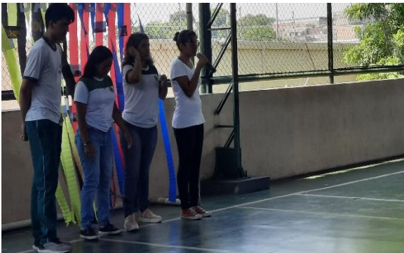
Figura 29: Apresentação 1º 3 – Boi Bumbá de Parintins