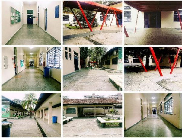
Figura 2: Estrutura Física da Escola Sólton de Lucena