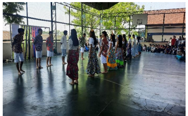
Figura 26: Dança Serafina