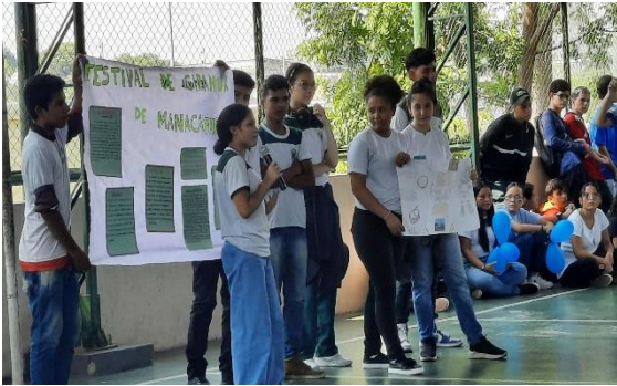
Figura 27: Apresentação 1º 2 – Ciranda de Manacapuru