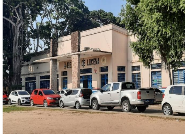
Figura 3: Fachada da Escola Sólton de Lucena