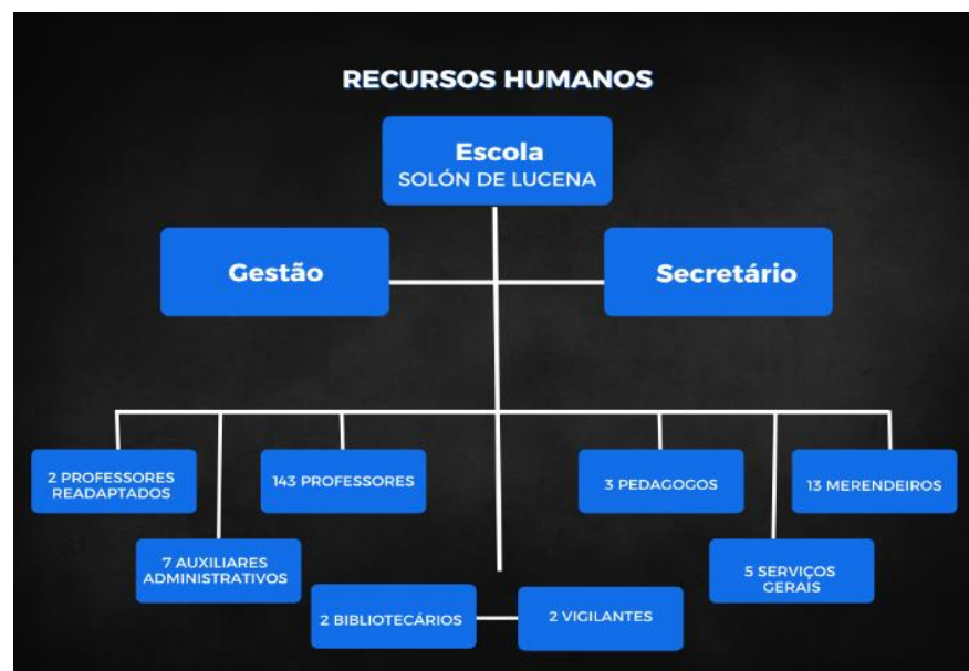
Figura 1: Organização Administrativa