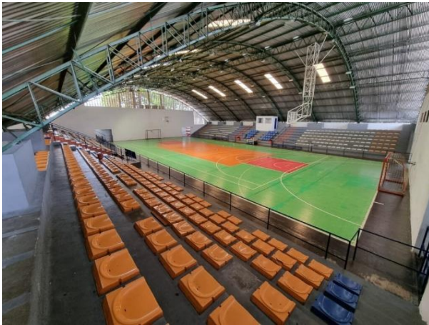
Figura 4: Ginásio Renné Monteiro