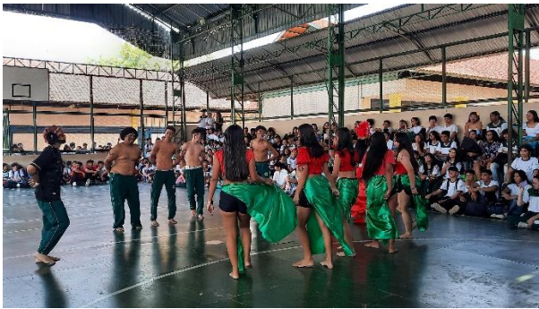
Figura 27: Apresentação 1º 5 – Festival de Maués