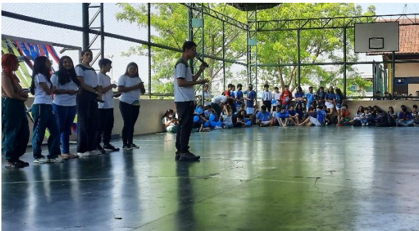
Figura 25: Apresentação 1º 4 – Ciranda de Tefé